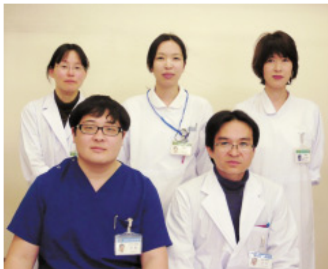
形成外科と皮膚科スタッフ

高松市民病院形成外科です。地域の先生方には、いつも患者さんを紹介していただきありがとうございます。当科は平成24年4月より新しい科として開設し、1年が経過します。患者さんの数は徐々に増えてはいますが、外来患者数・手術件数ともまだまだ不十分であるというのが現状であります。