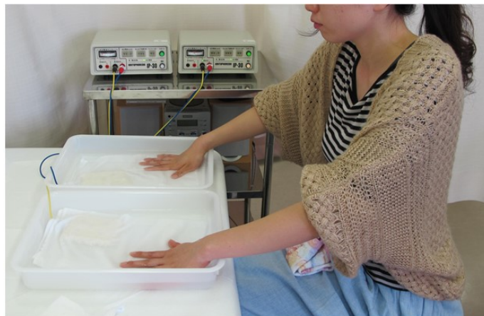
図1 イオントフォレーシス療法

塩化アルミニウムの単純外用/閉鎖密封療法が第1選択です。最近では腋窩の多汗症に抗コリン薬外用療法が保険適応となっています。さらに顔とか頭の多汗症では抗コリン薬の内服療法も適応となります。両手足の間で電流を通電するイオントフォレーシス療法は、手足の多汗症には有効な治療法であり、第1治療法とされています(図1)。第2選択の療法は腋窩の多汗症ではボツリヌス毒素の局注療法が保険適用となっています。第3選択療法は手足の多汗症のみ内視鏡的胸部神経遮断術が保険適応です。発汗異常外来では外用療法、内服療法、イオントフォレーシス療法をしています。あくまで対症療法ですので治療は継続する必要があります。