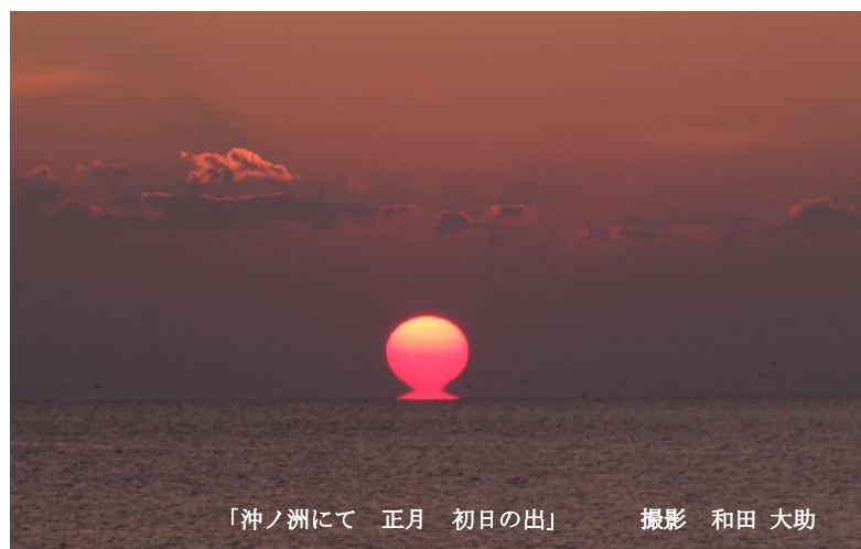
「沖ノ洲にて 正月 初日の出」