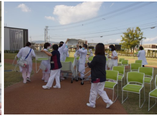
緑エリアの設置風景