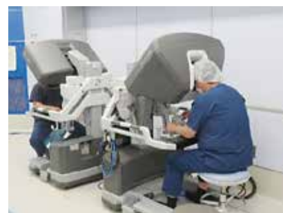
ダヴィンチ手術の様子