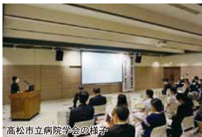
高松市立病院学会の様子