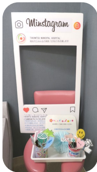
助産師さんが、心を込めて手作りました。